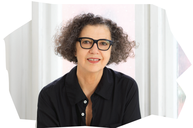
Mona Hatoum

In 2019 werd Hatoum gelauwerd met de Praemium Imperiale, een internationale erkenning voor haar oeuvre. Haar werk was onder meer te zien op documenta in Kassel (2002, 2017) en de Istanbul Biennial (1995, 2011). In 2015 organiseerde Centre Pompidou een overzichtstentoonstelling in Parijs, die in 2016 doorreisde naar Tate Modern (Londen) en KIASMA (Helsinki).