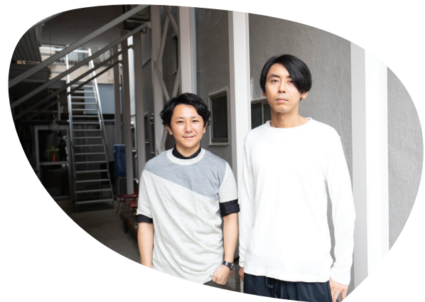
Shingo Masuda + Katsuhisa Otsubo Architects

Het werk van SO-IL werd recent bekroond met de United States Artists Fellow Prize (2022), de Prix de Rome (2014) en de MoMA PS1 Young Architects Prize (2010).