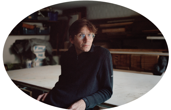
Adrien Tirtiaux

De installaties van Adrien Tirtiaux zijn onder meer te zien in de publieke collecties van het M HKA en het Middelheimmuseum in Antwerpen en de Sammlung des BMUKK in Wenen.