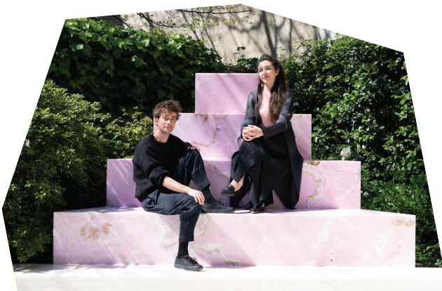
Studio Ossidiana

Het werk van Studio Ossidiana was recent te zien op de Istanbul Biennale (2019), de Chicago Architecture Biennial (2021) en de 23e Triennale di Milano, waar ze met Have we met? bekroond werden voor hun vernieuwende aanpak. In 2023 won het bureau de Premio italiano di Architettura 2023 met het Kunstpaviljoen M.