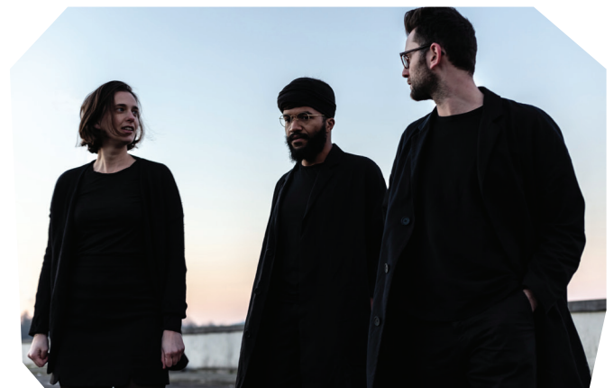
Traumnovelle © Barbara Salomé Felgenhauer

Traumnovelle verscheen op de internationale radar met Eurotopie , de Belgische bijdrage aan de Biennale di Venezia (2018). In 2022 ontwierpen ze de scenografie voor Horst Festival en waren ze te gast in Bozar met de tentoonstelling Project Palace . Recent was hun installatie Congolisation nog te zien in de tentoonstelling Style Congo. Heritage & Heresy in het Brusselse CIVA (2023).