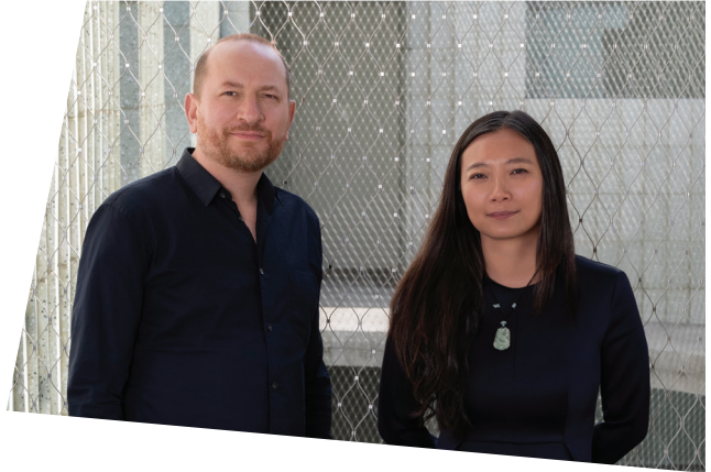
SO-IL