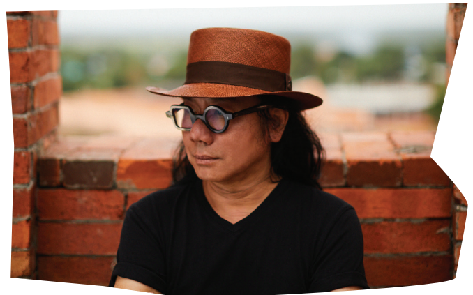
Bangkok Project Studio

In 2021 vertegenwoordigde Bangkok Project Studio Thailand op La Biennale di Venezia met A house for Human and a House for Elephants en werd zijn werk gelauwerd met de Golden Madonnina Design Prize binnen de categorie sociale impact in Milaan.